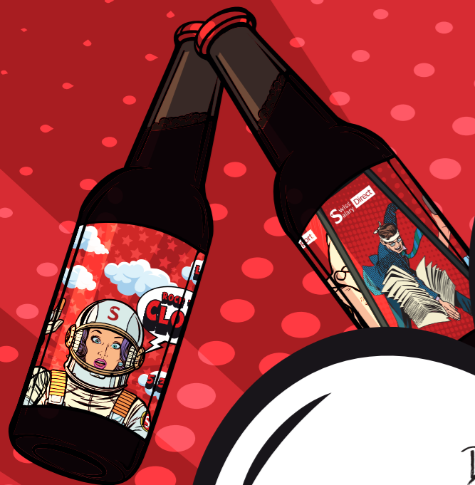
Illustration des événements d'équipe

Dans le dernier jeu-concours avant le 10e anniversaire de SwissSalary le 30 septembre 2022, on peut voir les différentes sorties d'équipe.